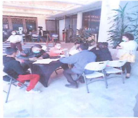
Revisando expedientes en CCMAA