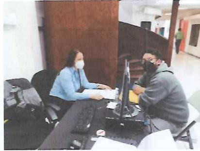
Elaboración de documento apoyo y resguardo de expedientes

Los expedientes, una vez revisados, evaluados artística y legalmente se trasladaron para su adecuado resguardo.