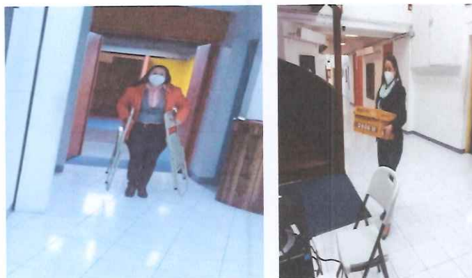
Resguardo de documentos y mobiliario

Se apoyó en el resguardo de equipo de cómputo y útiles de oficina, colocándolos al finalizar la semana laboral en la oficina dispuesta para tal fin, en el Centro Cultural Miguel Ángel Asturias para su adecuado resguardo.