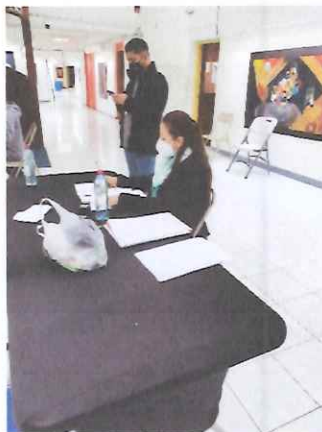
Revisión final de documentos