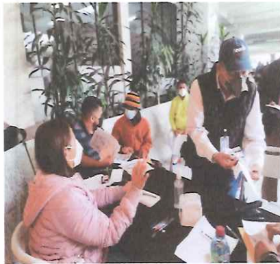
Revisando expedientes en CCMAA