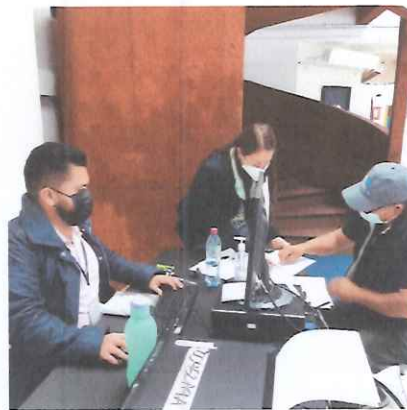
Revisión información detallada /elaboración documentos