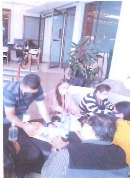
Revisión de expedientes